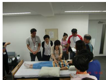
熱心な受講の様子

韓国から来た研修参加者の姿勢には当初驚きました。質問も積極的で、なぜそのような考え方をするのか、そのような仕組みになっているのか、韓国ではこのように考えるが日本ではどうか、などこちらが答えに困るようなときもありました。しかし事前に福祉の勉強をしていたときに聞いた“共に学ぼう”という気持ちで、日本も少子高齢化のなかで試行錯誤しながら新しい社会作りをしていることなどを説明して理解してもらいました。