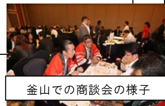
釜山での商談会の様子