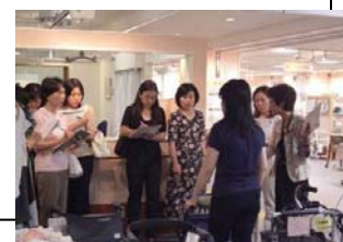
福祉用具視察の様子