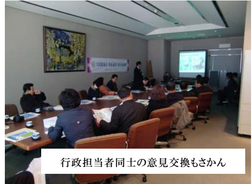
行政担当者同士の意見交換もさかん

高齢化社会に起こるさまざまな問題をどのように解決していくのか—アジアの共通の課題でもある。——右記事は福岡市が取り組む「安心コール」を紹介する釜山日報の記事。記事では荒江団地の管理事務所が独居老人入居者に定期的に連絡を入れることで孤独死を防ぐ取り組みとして紹介されている。コーディネート事業はこのような活動の共有を生むことになる。