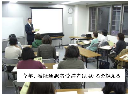
今年、福祉通訳者受講者は40名を越える