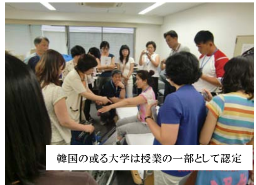
韓国の或る大学は授業の一部として認定